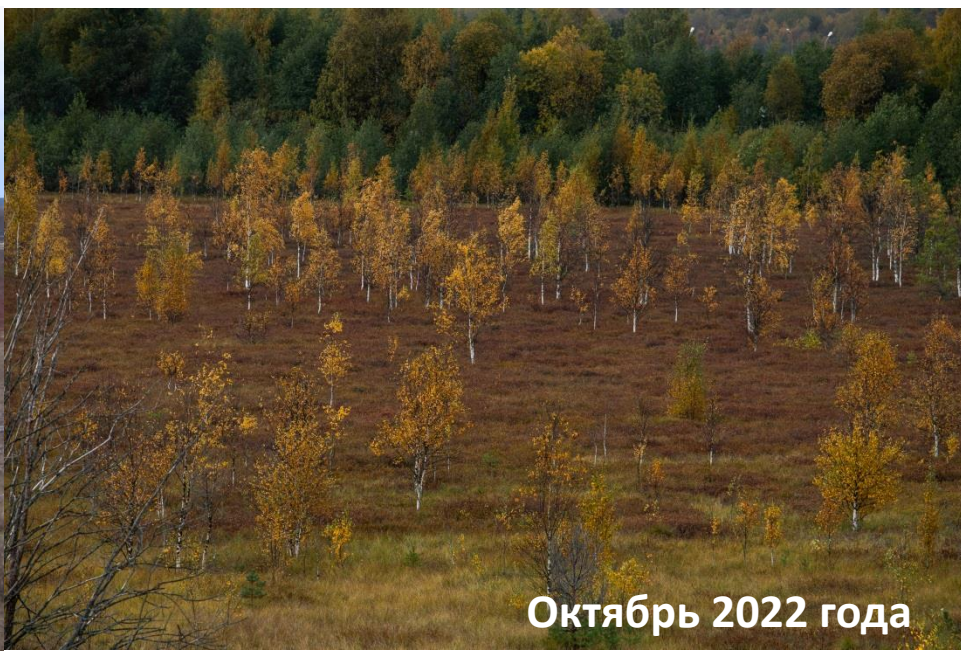
Октябрь 2022 года