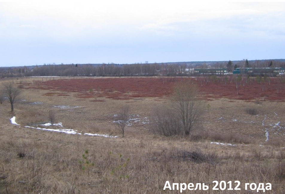
Апрель 2012 года